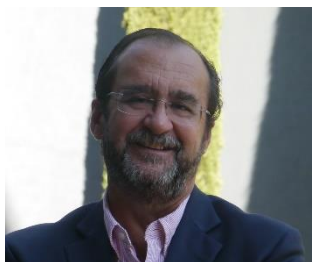
Antonio Cuadra Velázquez, 126 28006, Madrid Tlf: +34 607 78 12 00 acuadra@icomexcampus.com www.icomexcampus.com